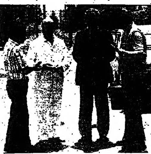
المحافظ غبريل ايلي شعيا متقدداً طرابلس